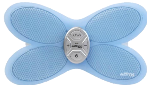
新商品「バタフライアブス ディープテック」