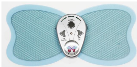
旧商品「バタフライアブス」

このように進化し、パワーアップした「バタフライアブス ディープテック」を 15,800 円（税別）で販売します。本体と交換用パッド（※約 30 回使用可能）が最初から 2 枚セットされており、約 2 カ月連続使用が可能と非常に経済的です。※1 枚あたり約 30 回使用可能で 1 日 1 回使用の場合