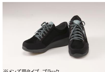
※メンズ用タイプ ブラック