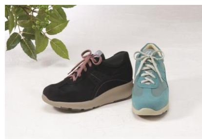
※レディース用タイプ 左:ブラック、右:ブルー