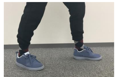
普通のスニーカー

「LOCOSXワイドステップウォーカー」のソールは健康歩行を促す形状になっています。