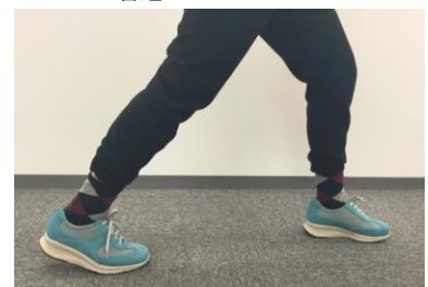
LOCOSX ワイドステップウォーカー

アウトソールのかかと部・つま先にクッション材を内蔵。柔らかな履き心地を実現すると共に、クッションを踏みつけることで脚の筋肉活動量がアップします。砂浜を歩いているような感覚で脚を鍛えながら、楽に足を鍛える事が可能になります。