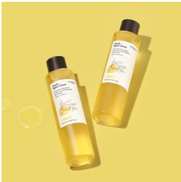
(写真：ゆずC ダークスポット クリア トナー)