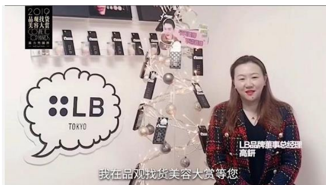
＜ビデオレターでコメントを寄せる中国法人総経理の高＞

2019年12月16日（月）に2019年品観アプリが「未来に輝く美容商品の大賞」を発表しました。評価の基準は美容専門家が選定、今売られている商品だけではなく、将来的に人気ができる商品も合わせて選定した結果、コスメ部門でLBが「10大人気メイクアップブランド賞」を受賞しました。