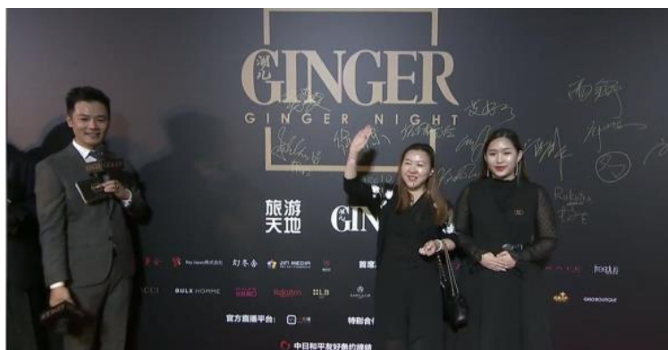
< 艾瑞碧(上海)化粧品有限公司（シャンハイエルビー）総経理高と、メイクアップ担当何 >