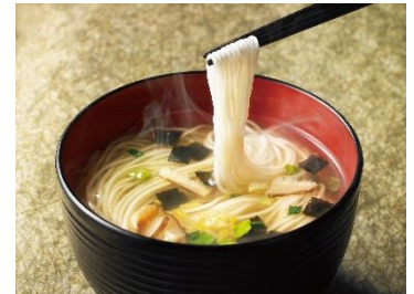
<ローカロ麺定番シリーズ>