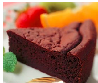
<豆乳ガトーショコラ>