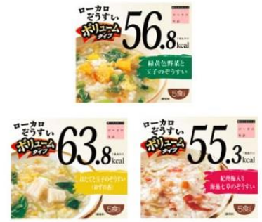
<和の極みシリーズ>