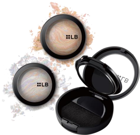
ミラー付きコンパクト、ふんわりブラシ付き