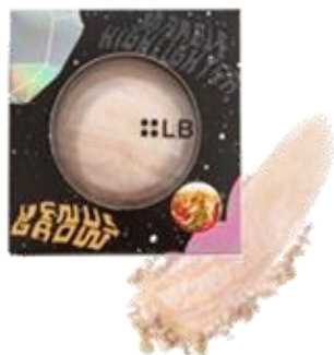
MH-1 ヴィーナスグロウ