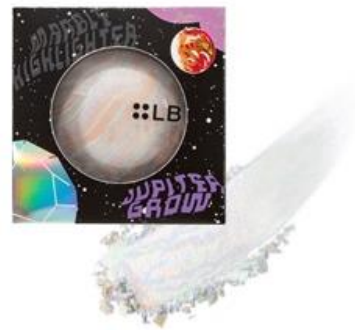
MH-2 ジュピターグロウ