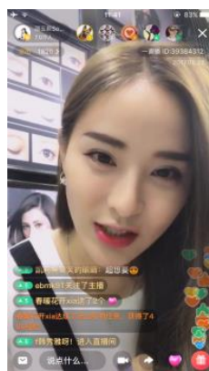
インフルエンサー 邵玉菲