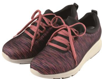
<レディース/コーラル系>