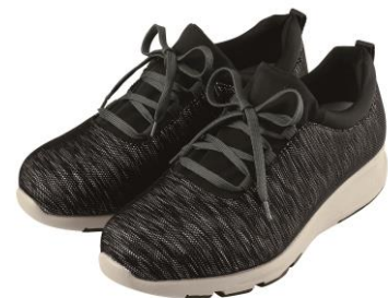
<メンズ/ブラック系>