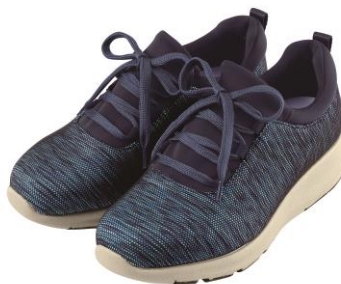
<レディース/ブルー系>