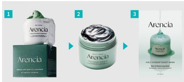
プレミアムもちソープ 「グリーン」