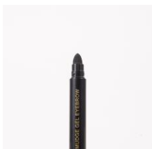
★シリコン製 スマッジチップ