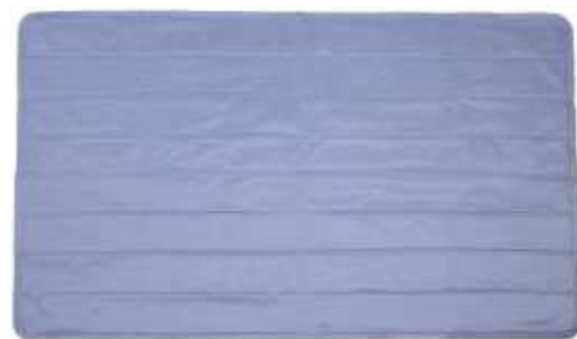
白クマきぶん流水マット

価格： 7,800円（税別） サイズ： 140 x 90cm（シングルサイズ） 色： ブルー系 素材： 側地 ポリエステル（裏面：PVCコーティング） 中材 硫酸ナトリウム 他 重さ： 6.5kg（シングルサイズ） 生産国： 中国