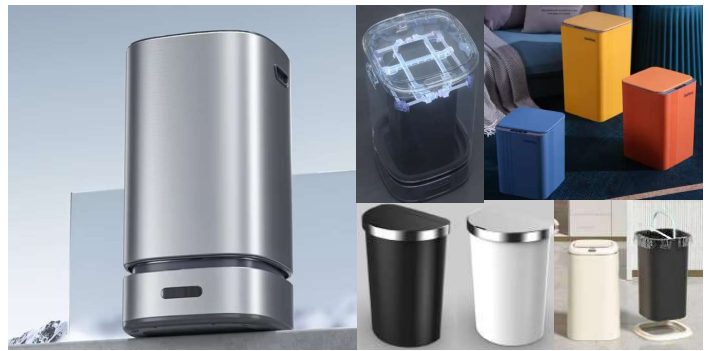
※イメージ画像（実際の商品とは異なる場合がございます。）

他にもいくつかの新商品を展示する予定がございますので、ぜひブースにお立ち寄りください。