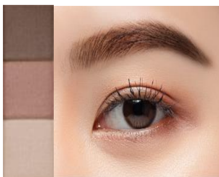
・PB-2 Natural Brown ナチュラルブラウン 赤茶系のナチュラルな髪色に