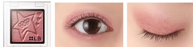
GS-12 Beat Star ビートスター