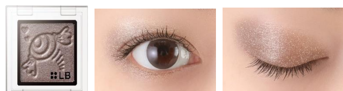
GS-10 Mystery to ME ミステリートゥーミー