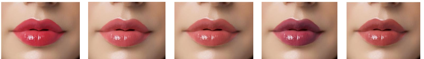
・GRS-1 サマーレッド ・GRS-2 トロピカルピンク ・GRM-3 パッションオレンジ ・GRS-4 ビターカシス ・GRS-5 ヌーディーベージュ

シアーな発色でグロスのようなツヤ感。伸びが良く透け感、抜け感ツヤ感を兼ね備えた勝負ルージュ! クリスタルのような透け感でみずみずしいぷっくり唇を演出します。