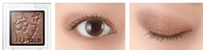
GS-11 ms.B. ミス・ビー