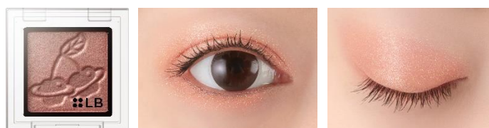
GS-8 Cherryco チェリーコ