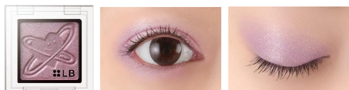
GS-9 Love Ship ラブシップ