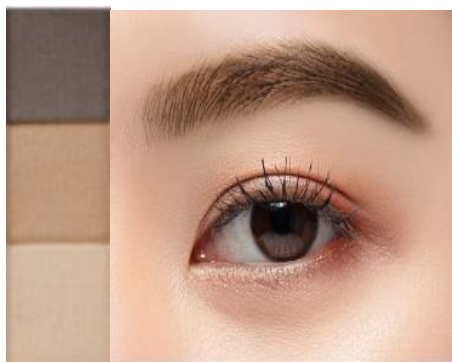
・PB-1 Yellow Brown イエローブラウン イエロー系の明るめの髪色に