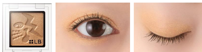
GS-7 Impact 'n' Yellow インパクトニャロー