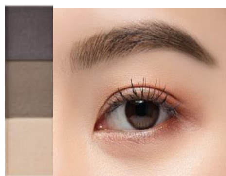
・PB-3 Ash Gray アッシュグレイ 黒髪や暗めの髪色に