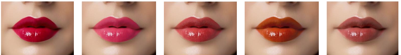
・GRM-1 ルビーレッド ・GRM-2 ネオピンク ・GRM-3 スパイシーコーラル ・GRM-4 ブリックブラウン ・GRM-5 タンローズ ハンサム美人なルビーレッド ビビッドな青みピンク ゴールドパールが艶めくスパイシーコーラル おしゃれ顔に彩るテラコッタ 王道のヌーディーカラー

発色が良くしっとりとしたうるおい感。肌なじみが良く色っぽレディに昇華! しっかり発色し、ほどよい抜け感で大人の魅力を引き出す勝負ルージュで、ジューシーでしっとりとした唇を演出します。