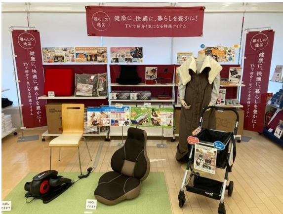
▲手芸専門店「クラフトハートトーカー」 20店舗でプライムダイレクト商品を販売。 実際に体験できるブースも併設。