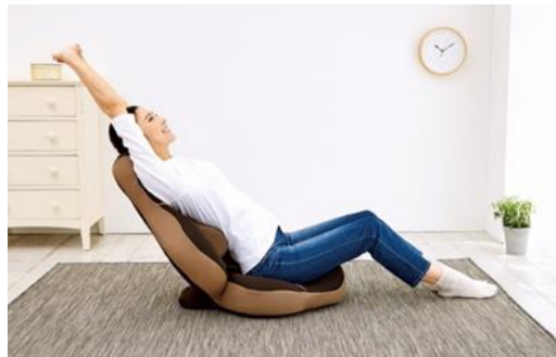
▲腰楽ストレッチ座椅子 グイッス

プライムダイレクトのバリューに「楽しく、健康に生きる」があります。それを伝える場として“楽しく、健康に生きている方々”が集う聖域とも言える手芸専門店を選択しました。それに基づき、取り扱い商品も日々を楽しく生きるために生活を便利にするショッピングカート「EcoCa（エコカ）」や、料理を楽しくするスクエア型フライパン「シカクック」、さらに健康にハンドクラフトを楽しむための「腰楽ストレッチ座椅子 グイッス」など全16品を取り揃える予定です。（店舗によって取り扱い品数は異なります）TVショッピングで見た商品に実際に触れて、試せるこの場で当社のバリューを実感していただくことを目指します。